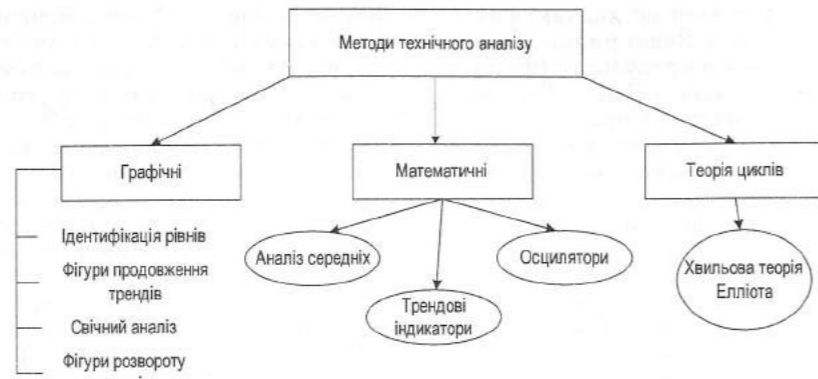
Рис. 1. Класифікація методів технічного аналізу

ку можуть побачити різні графічні фігури та зробити різні висновки за результатами аналізу). В цілому ці методи є важливою і необхідною складовою технічного аналізу і достатньо ефективні в поєднанні з іншими методами.